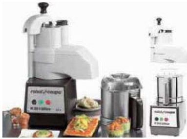
Cutter & vegetable slicer R301 Ultra Combinato cutter/tagliaverdure Gemüseschneid-/ u. Schälmaschine Cutter/Coupe-légumes Cortador verduras

Die-cast housing for heavy-duty use. Equipped with patented LiquiLock® sealing system. Over 20 processing options. Included discs: S-blade, emulsifying disc, adjustable slicing disc, reversible shredding disc. Involucro pressofuso per uso intensivo. Equipato con il sistema di tenuta LiquiLock® brevettato. Scivolo di alimentazione continua. Oltre 20 opzioni di lavorazione. Dischi incl: lama a S, disco emulsionante, disco per affettare regolabile, disco per sminuzzare reversibile.