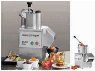
Vegetable preparation machine CL 50 Ultra Tagliaverdure Gemüseschneidmaschine Coupe-légumes Cortador verduras