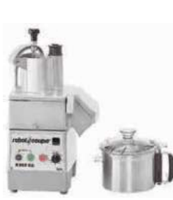
Cutter & vegetable slicer R502 VV Combinato cutter/tagliaverdure Gemüseschneid-/ u. Schälmaschine Cutter/Coupe-légumes Cortador verduras

For cutting discs contact our customer service. Per i dischi di taglio contattata il ns customer service.