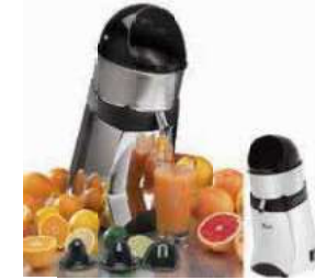
Citrus fruit squeezer Spremiagrumi Zitruspresse Presse agrumes Exprimidor cítricos

Extraction basket, bowl, and lid in stainless steel. Cestello di estrazione, ciotola e coperchio in acciaio inox.