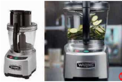
Cutter/Mixer food processor Robot da cucina cutter/mixer Küchenmaschine Cutter/Mixer Robot culinaire cutter/mixer Robot de cocina cutter/mixer

Suitable also for cutting mozzarella. For cutting discs contact our customer service. – Ideale anche per tagliare mozzarella. Per i dischi di taglio contattata il ns customer service.