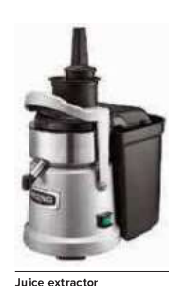
Juice extractor Estrattore di succo Entsafter Extracteur de jus Extractor de jugo

Automatic pulp ejection system. Turbo switch for basket cleaning. Air cooled universal motor for continuous use. Max power 800W. – Sistema automatico di espulsione della polpa. Interruttore turbo per la pulizia del cestello. Motore universale raffreddato ad aria per uso continuo. Potenza massima 800W.