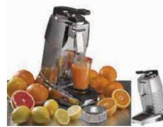
Citrus fruit squeezer Spremiagrumi Zitruspresse Presse agrumes Exprimidor cítricos