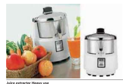
Juice extractor Heavy use Estrattore di succo Entsafter Extracteur de jus Extractor de jugo

Extraction basket, bowl, and lid in stainless steel. Cestello di estrazione, ciotola e coperchio in acciaio inox.