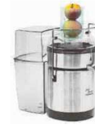
Juice extractor Estrattore di succo Entsafter Extracteur de jus Extractor de jugo