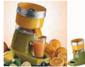
Citrus fruit squeezer Spremiagrumi Zitruspresse Presse agrumes Exprimidor cítricos

For cutting discs contact our customer service. Per i dischi di taglio contattata il ns customer service.